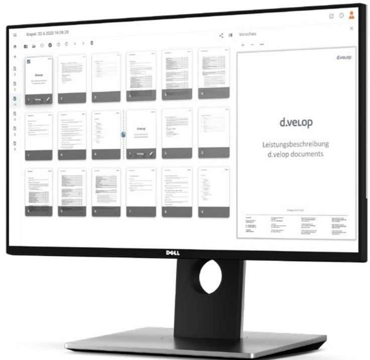
Der Dokumenteneingang von d.velop documents: Dokumentenstapel können automatisch analysiert, bearbeitet und separat archiviert werden.

d.velop documents basic ist ideal, wenn Sie einen schnellen Einstieg in die Digitalisierung schaffen oder Ihren Mitarbeitern die Arbeit im Home-Office ermöglichen wollen. Mithilfe der grundlegenden Dokumentenmanagement-Funktionen können Sie endlich von lästigem Papierkram Abschied nehmen. Mit d.velop documents können Sie papiergebundene Informationen im Handumdrehen digitalisieren und revisions sicher archivieren. Ganz gleich, ob es sich dabei um ein Dokument oder ganze Ordner handelt. So können Sie in wenigen Schritten große Mengen (Stapel) an Dokumenten einscannen, hochladen oder per Mail erfassen.